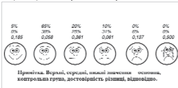
Мал. 2. Виразеність стомадинії на 6-й день лікування

Із даними динаміки зникнення афтозних елементів узгоджується їх тривалість, виражена медіаною.